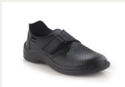
MyCodeor Velcro Liso