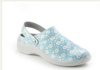
Codeor San azul